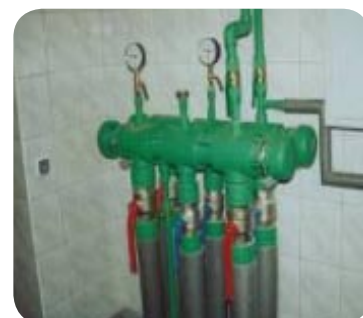
Pompy ciepła o mocy 120 kW