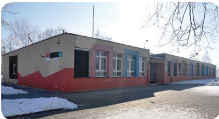
Budynek szkoły w Cedrach Wielkich

Pompa ciepła doskonale współpracuje z kolektorami słonecznymi do przygotowania ciepłej wody użytkowej. Jak dla każdego budynku, decyzja o wyborze źródła ciepła powinna być poprzedzona analizą techniczną i ekonomiczną. Pompy ciepła zostały zainstalowane między innymi, w budynku szkoły podstawowej w Cedrach Małych. Instalacja pomp ciepła została poprzedzona termomodernizacją budynku, w którym wymieniono okna, ocieplono ściany zewnętrzne i ocieplono stropodach.